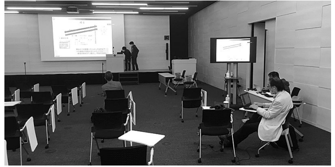
コントロールセンター